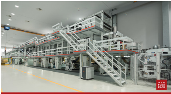
Die RC-17 Maschine in Drnis (Kroatien) ist das Herzstück der Folienproduktion für Kaffee kapseln.

Das Segment "Lithium-Ion Solutions & Microbatteries" verzeichnete einen Anstieg um 2,7 % auf € 121,9 Mio. und „Household Batteries“ erzielte einen Umsatzanstieg von 3,4 % auf € 82,4 Mio. (2020: € 79,7 Mio.), wozu der Bereich "Energy Storage Systems" mit einer Umsatzverdoppelung zur Vergleichsperiode im Vorjahr wesentlich beigetragen hat.