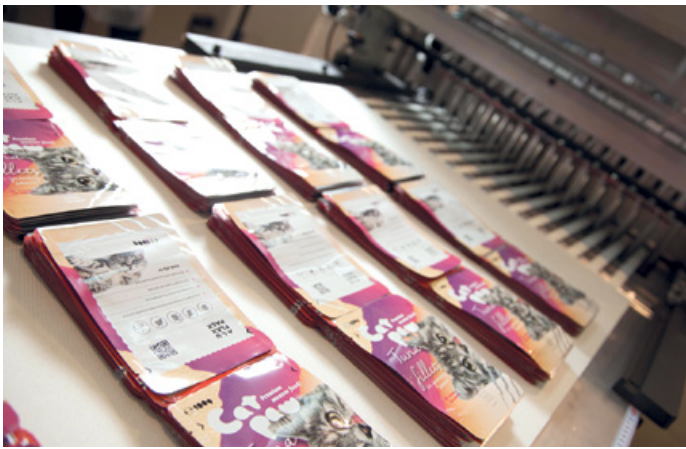
Zukünftig werden bis zu 1 Mrd. Standbodenbeutel in Umag produziert.

Die ASTA Gruppe ist mit einem schwierigen Umfeld konfrontiert, ausgelöst durch die zurückhaltenden Investitionstätigkeiten im klassischen Kraftwerksbau. Mit der Markt- und Qualitätsführerschaft in der Produktion von isolierten Flachdrähten – im Speziellen Drilleiter – gelingt es dem Preisdruck im Wesentlichen standzuhalten und nur geringe Mengeneinbußen hinzunehmen. Die ASTA Gruppe geht davon aus, dass mit keiner kurzfristigen Änderung des Umfeldes zu rechnen ist.