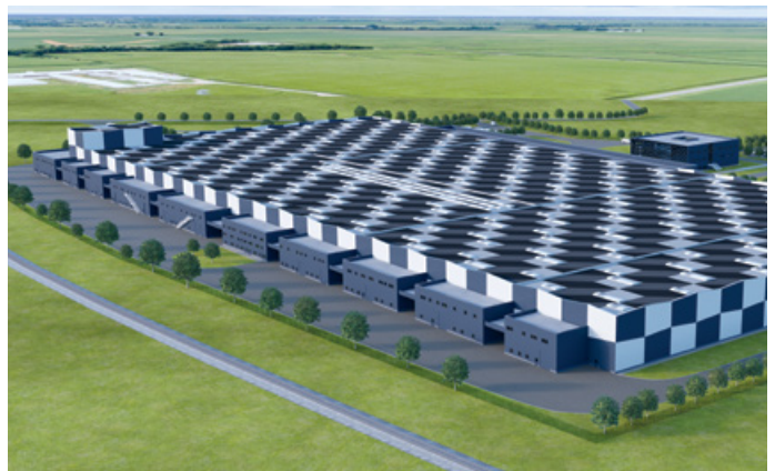
Direkt am Flughafen gelegen: UAC Standort in Baia Mare, Rumänien.

Auch die UNIVERSAL ALLOY CORPORATION (UAC) setzt den Wachstumskurs fort und unterstreicht diesen mit dem Startschuss zum Bau eines weiteren Standortes in Vietnam. Damit wird die Produktionskapazität zusammen mit dem in Bau befindlichen Standort am Flughafen von Baia Mare mehr als verdoppelt. Mit diesen Standorten wird die Division Aerospace Components das Produktionsportfolio um die Verarbeitung von Titan erweitern.