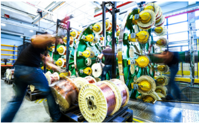
Dank Weltmarktführung in der Herstellung von Kupferkomponenten für Transformatoren und Generatoren im Hochenergiebereich kann ASTA alle renommierte globale Unternehmen des Elektromaschinenbaus zu seinen Kunden zählen und bewegt sich somit in einem stabilen Umfeld.

Die ASTA Gruppe musste in China und Indien aufgrund behördlicher Bestimmungen im Zuge der COVID-Pandemie temporäre Werksschließungen vornehmen. Aufgrund der vollen Auftragsbücher wird aber mit keiner oder einer nur geringen Auswirkung auf das Ergebnis gegenüber Plan gerechnet.