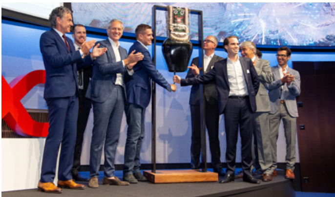
Die Aluflexpack Aktie notiert seit 28. Juni 2019 an der SIX Swiss Exchange, der Ausgabepreis wurde mit CHF 21 festgelegt.

innovativen Produkten in allen Segmenten entgegenwirkt. Weiters ist die ALPINE METAL TECH zuversichtlich, damit den Grundstein für weitere Wachstumsmöglichkeiten sowohl im "Automotive", als auch im Bereich Stahl und "Safety Services" gelegt zu haben.