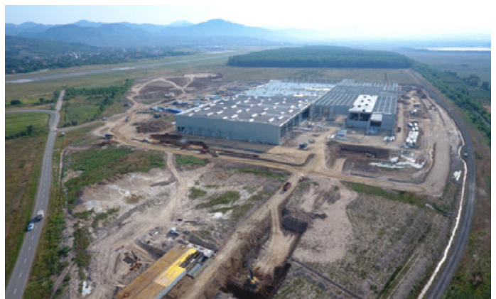
Baia Mare, Rumänien

Die VARTA AG (Division Energy Storage ), weltweit agierender Experte für Mikrobatterien mit einer marktführenden Position bei Hörgerätebatterien sowie bei Lösungen für Hearables, Power Packs und Energiespeicher, konnte das erfolgreichste 1. Halbjahr in der Firmengeschichte erzielen. Der Umsatz liegt mit € 151,5 Mio. um 15,8% über dem Vorjahresniveau. Das profitable Wachstum insbesondere bei den Lithium-Ionen-Batterien wird sich weiter beschleunigen und die VARTA AG investiert daher massiv in den Ausbau neuer Produktionskapazitäten auf über 80 Millionen Zellen jährlich Anfang 2020 und auf deutlich über 100 Millionen Zellen jährlich bis Ende 2020. Hintergrund ist die ungebrochen sehr hohe Kundennachfrage in einem Markt, der jährlich über 30 Prozent wächst. Die Kapazitätserweiterung erfordert ein zusätzliches Investitionsvolumen von rund 100 Millionen EUR (für zusätzlich 40 Mio. Zellen pro Jahr).