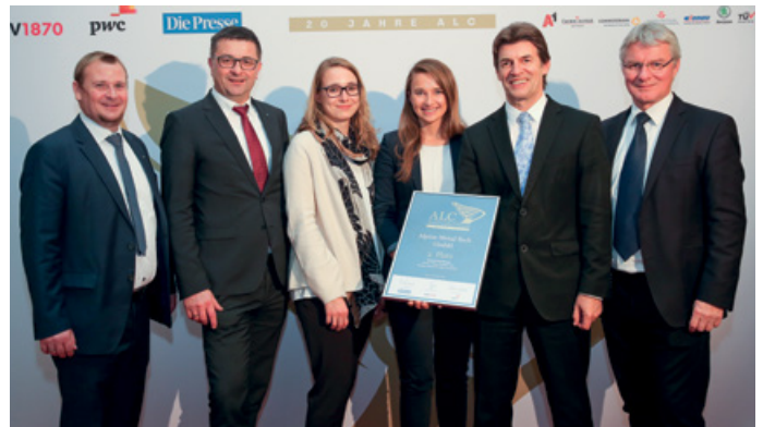
AMT: "Austria's Leading Companies" Award

Die Division Metal Tech steigerte den Umsatz gegenüber dem Vergleichszeitraum des Vorjahres um 4,8%. Der Bereich "Safety Services" trug wesentlich zur Umsatzsteigerung bei. Die ALPINE METAL TECH legt ihren Fokus weiterhin auf Forschung und gezielte Unternehmensentwicklung, um den Umsatz zukünftig in allen Segmenten mit innovativen Produkten zu steigern. Bestätigt wurde dieser Kurs durch "Austria's Leading Companies" mit einem Award in der