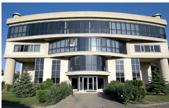
ARİMPEKS ALÜMİNYUM, Istanbul

Die ASTA Gruppe ist seit Jänner 2018 vollkonsolidiert. Während der Standort in China die maximale Auslastung erreicht hat und Investitionen in eine Kapazitätserweiterung geprüft werden, gilt es in den anderen Standorten die vorhandenen Kapazitäten zu nutzen um den Marktanteil unter Beibehaltung der Margen auszuweiten. Die weltweite Präsenz im Bereich Drillleiter ist damit gefestigt, in den kommenden Monaten wird der Grundstein für weitere Innovationen und den Eintritt in neue Marktsegmente gelegt.