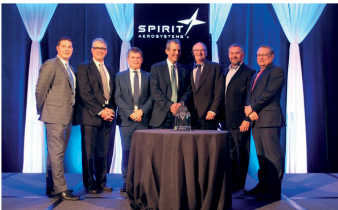
Das Rennen unter den besten Zulieferern der Branche konnte Universal Alloy Corporation Europe in diesem Jahr für sich entscheiden und als Top-Performer den renommierten Spirit Award entgegennehmen.

Auch die ALPINE METAL TECH spürt die Schwäche im Automobilbereich, womit der zuletzt sehr erfolgreiche Wachstumskurs gebremst wurde. Mit innovativen Produkten in allen Segmenten ist der Grundstein für zukünftiges Wachstum gelegt – sowohl was den Bereich Automotive betrifft, als auch die Bereiche Stahl und “Safety Services”.