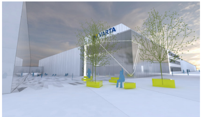
Gemeinsam mit dem Architekturbüro querkraft werden in den Standorten Nördlingen und Ellwangen (Bild) die geplanten Aus- wie auch Neubauten der VARTA AG umgesetzt.

Die VARTA AG (Division Energy Storage ), weltweit agierender Experte für Mikrobatterien mit einer marktführenden Position bei Hörgerätebatterien sowie bei Lösungen für Hearables, Power Packs und Energiespeicher, kann weiter auf eine hohe Wachstumsdynamik verweisen. Mit einem sehr starken dritten Quartal lag der Umsatz der ersten 9 Monate mit € 242,8 Mio. um 21,3% über dem Vorjahresniveau. Der Erfolg ist vor allem auf die Lithium-Ionen Technologie zurückzuführen – als Innovations- und Technologieführer profitiert die VARTA AG von dem stark wachsenden Marktsegment der Premium Headsets. Dafür wird massiv in den Ausbau der Produktionskapazitäten investiert, um damit die Basis für weiteres Wachstum zu legen. Die Kapazität für wiederaufladbare Lithium-Ionen Batterien