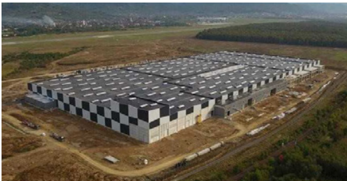
Das neue Werk der Montana Aerospace in Baia Mare, Rumänien soll nach seiner Fertigstellung im Frühjahr 2021 und der Bewältigung der COVID-19 Krise mit einer Produktionsfläche von mehr als 80.000 m 2 viele Arbeitsplätze schaffen und attraktive Aufträge umsetzen.

Die ALUFLEXPACK AG hat ihren Umsatz in den ersten neun Monaten um +14,0% auf 176,7 Mio. EUR gesteigert. Während der Krise blieb die Nachfrage nach Lebensmitteln, Tiernahrung und pharmazeutischen Produkten auf einem soliden Niveau. Das Management präzisierte seinen Ausblick auf das Geschäftsjahr 2020 und rechnet nun mit der oberen Hälfte der erwarteten Umsatz- (220–230 Mio. EUR) und bereinigten EBITDA (32–35 Mio. EUR)