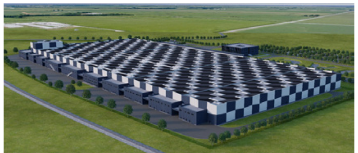
Auf einer Fläche von über 80.000 Quadratmetern entsteht neben einer modernen Produktionsstätte und einem Flughafen auch ein UAC Trainings- und Designcenter und sorgt für 1.600 neue Arbeitsplätze in der Region.

Die Division Metal Tech konnte nach der äußerst erfolgreichen Restrukturierung 2017 im Geschäftsjahr 2018 das Ergebnis festigen und nochmals verbessern. Dazu trug unter anderem der Bereich "Safety Services" wesentlich bei. Die ALPINE METAL TECH legt ihren Fokus weiterhin auf Forschung und gezielte Unternehmensentwicklung, um den Umsatz zukünftig in allen Segmenten mit innovativen Produkten zu steigern.