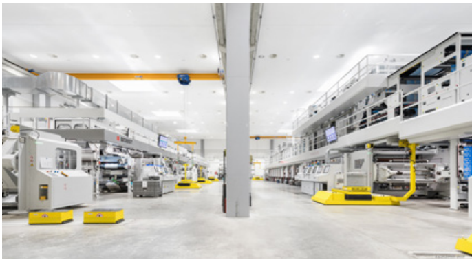
Der Standort der Aluflexpack in Umag ist auf Rotationsiefdruck, Laminierung und Herstellung von Pouches spezialisiert.

weitere Verbesserungen in der Produktion erzielt wurden, spürt der Standort die aktuelle Schwäche im Automotive Bereich. Mit den noch anstehenden Kundenqualifikationen wird die Auslastung des Standortes sukzessive verbessert werden. Damit verfügt die ALUMENZIKEN über einen hochkompetitiven Standort, der auch im Falle eines umkämpften Marktes für die Zukunft bestens gerüstet ist.