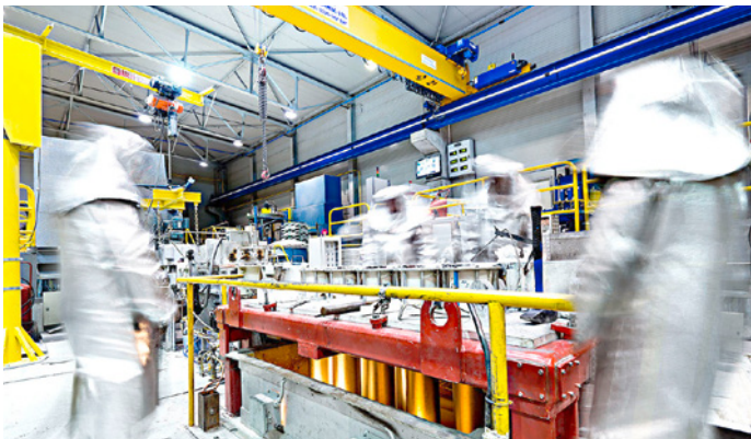
MONTANA AEROSPACE steht mit seinen modernen Werken für höchste Standards in Qualität, Sicherheit und Service – von der Rohmaterialaufbereitung inklusive Recycling bis zur Montage der Baugruppen. Die Industriegruppe agiert kosteneffektiv und verlässlich entlang der gesamten Wertschöpfungskette.

allgemein robuste Nachfrage nach verpackten Lebensmitteln, Pharmazeutika und Tiernahrungsmitteln im aktuellen Umfeld zurückzuführen. Nebst der Akquisition der polnischen Tochtergesellschaft Top System im September war die Bekanntgabe eines € 65 Mio.-Investitionsprojekts in Kroatien eines der Highlights in der abgelaufenen Berichtsperiode. Die Konzernleitung rechnet für 2021 mit einem anhaltend guten Wachstum und einem Nettoumsatz zwischen € 260–270 Mio.